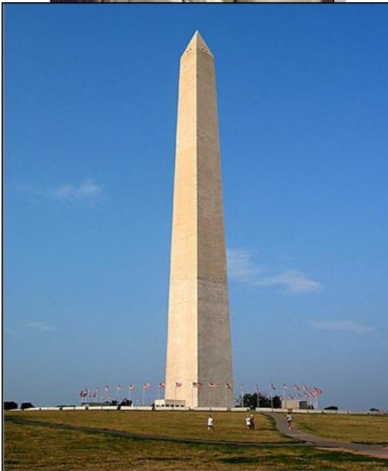
Washingtonský památník byl postaven k uctění prvního amerického prezidenta George Washingtona, který byl také zednář