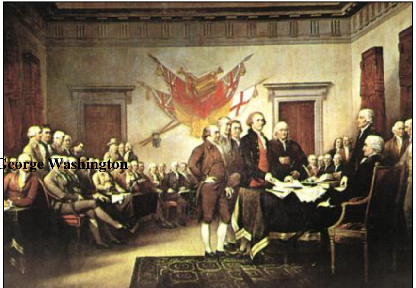
Deklarace nezávislosti Spojených států amerických , dokument oznamující důvody vyhlášení nezávislosti USA, schválený 2. kontinentálním kongresem 4. 7. 1776.